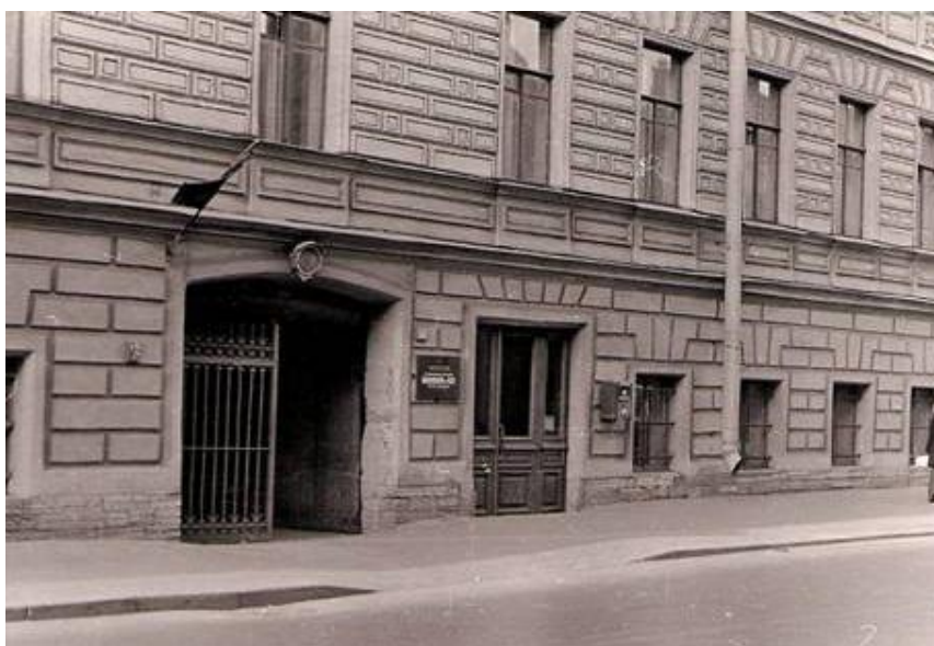
Здание школы на ул.Войнова